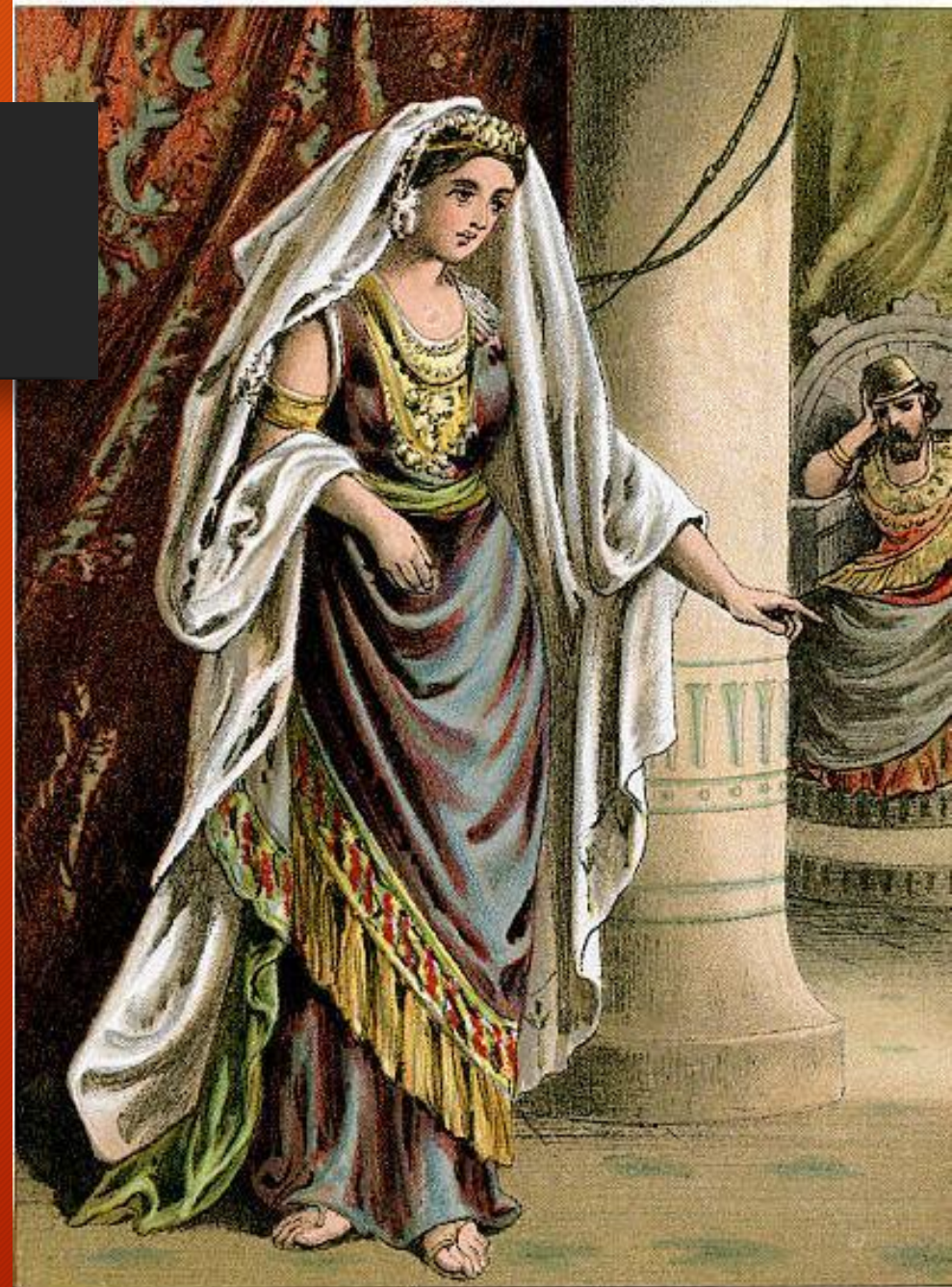
ESTHER STANDING IN THE INNER COURT OF THE KING'S HOUSE